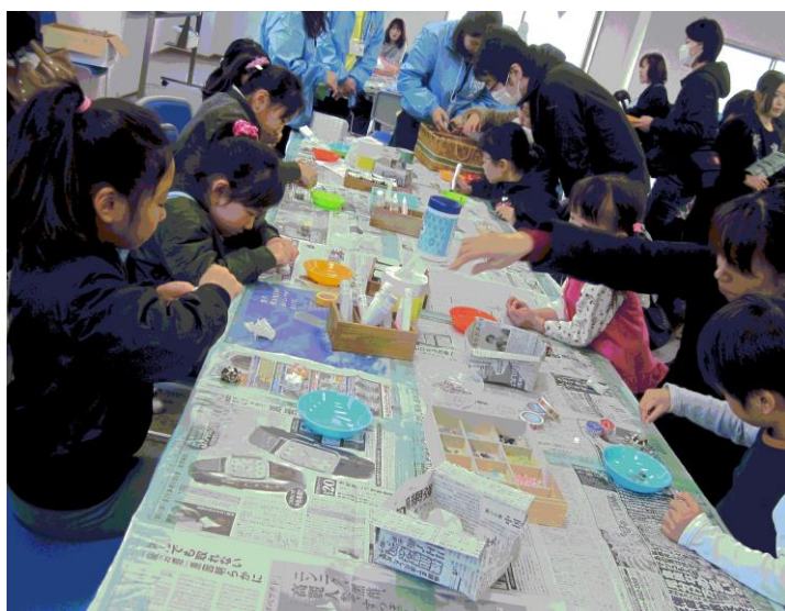
エコワークショップ