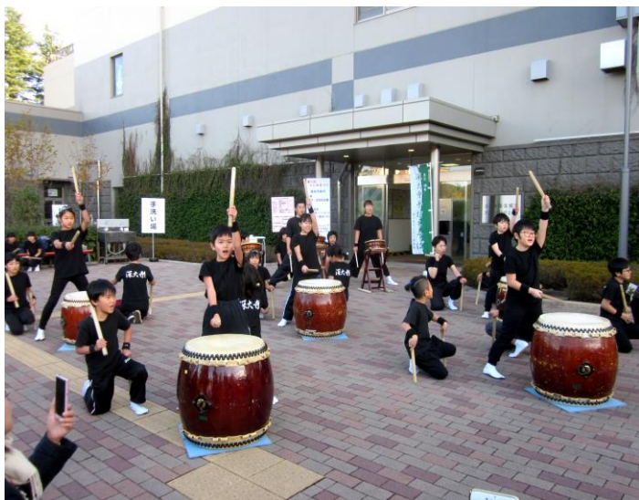
深大寺児童館の和太鼓サークルの演奏