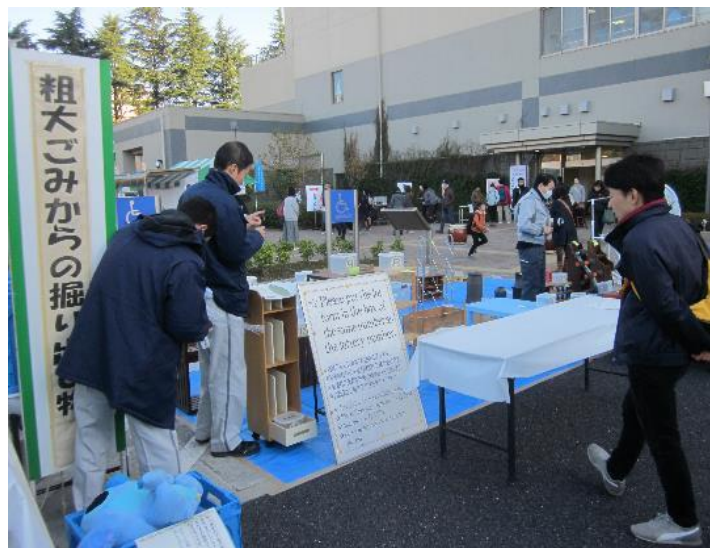
リサイクル品の販売「粗大ごみからの掘り出し物」