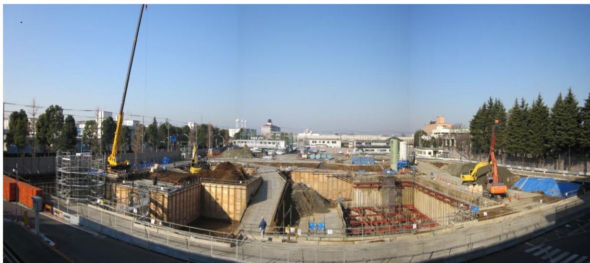
【煙突部の鉄筋組み立て】