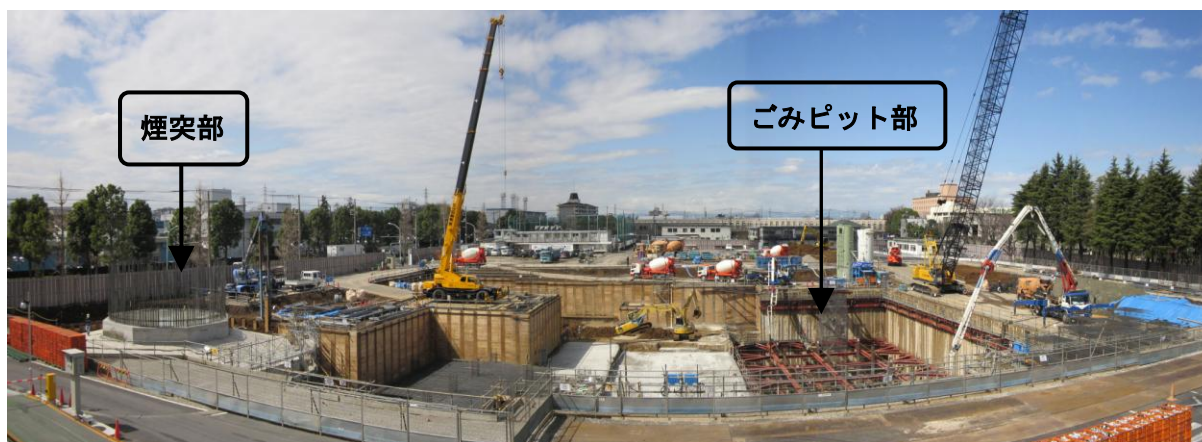
【煙突部の鉄筋組み立て】