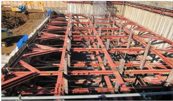
【ごみピット部の山留め】