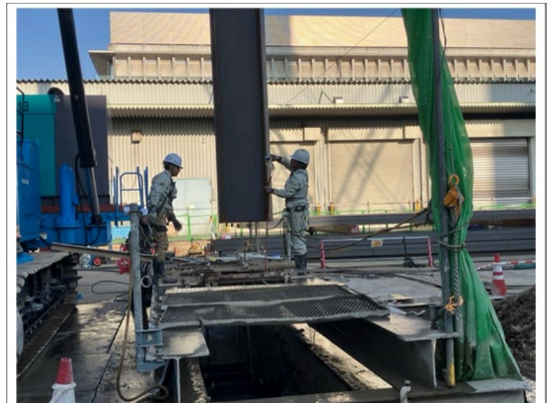
ごみピット周囲の山留設置工事中 (隣接する焼却施設から工事エリアを撮影)