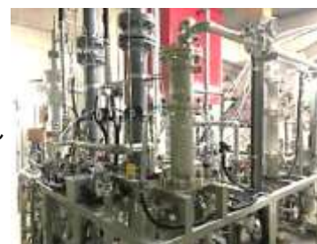
CO2分離回収試験設備

一方、現在の技術では、CO 2 の回収に多くのエネルギーが必要であること、実用化レベルのCO 2 の回収施設を整備するためには、焼却施設と同等かそれ以上の用地が必要であること、CO 2 を効率的に運搬するためには、CO 2 を液化する必要があることなど、解決しなければならない課題も、たくさんあります。これらの課題の解決に向け、ふじみ衛生組合では、引き続き実証実験を行ってまいります。