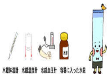
水銀体温計 水銀温度計 水銀血圧計 容器に入った水銀

水銀回収キャンペーン（平成30年12月実施）ご協力ありがとうございました。 水銀体温計・水銀血圧計・水銀温度計など248点を回収いたしました。 （ふじみまつり（11/25開催）でも8点回収し、合計256点回収しました。）