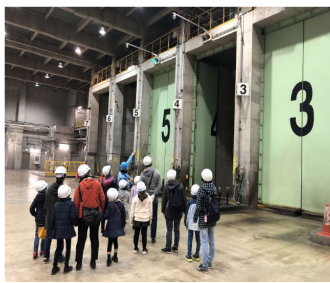
親子探検隊（プラットフォーム）