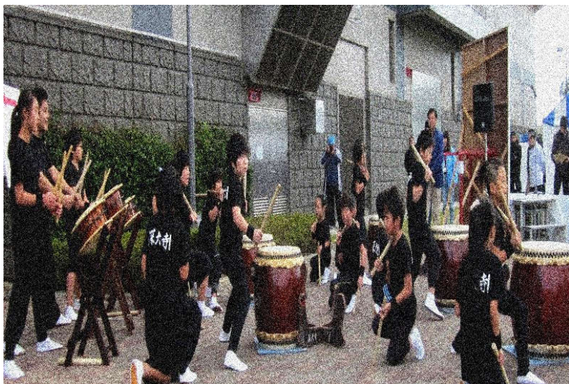
深大寺児童館和太鼓サークルの演奏