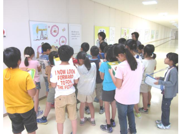
【グループごとに説明をうける子どもたち】