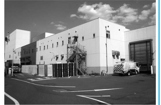
リサイクルセンター

両施設の運営に当たっては、環境と安全に徹底的に配慮することを第一に、市民の皆様から信頼される施設づくりに取り組んでいます。