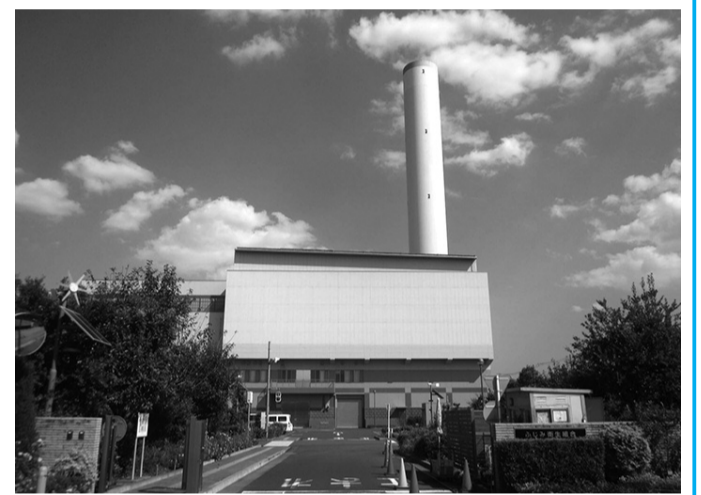
クリーンプラザふじみ