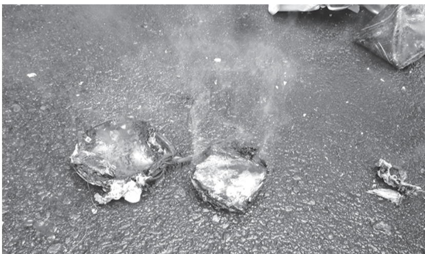
選別処理中にショートして発煙したモバイルバッテリー